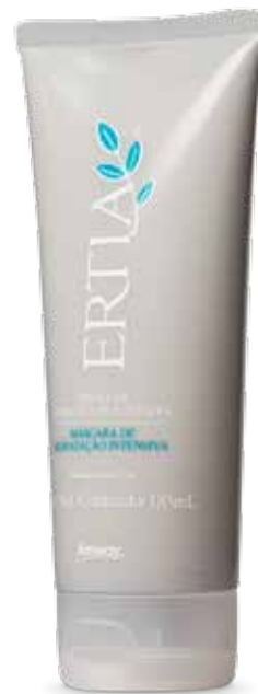
No. de Artículo 106446 Cont. 185ml

* Resultados obtenidos en paneles de estudio realizados por la compañía.