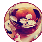
Té de Rosas