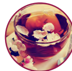
Té de Rosas